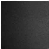
GF69 graphite gaufriert