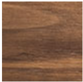
NC nussbaum canaletto