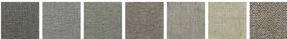
B541 B710 B711 B712 B713 B714 B720