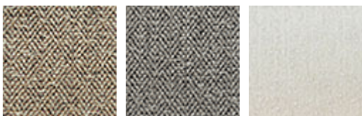
B721 B722 Bouclé 01