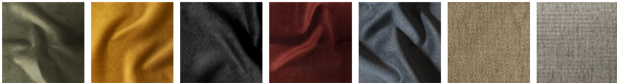
B234 B235 B236 B238 B239 B401 B403