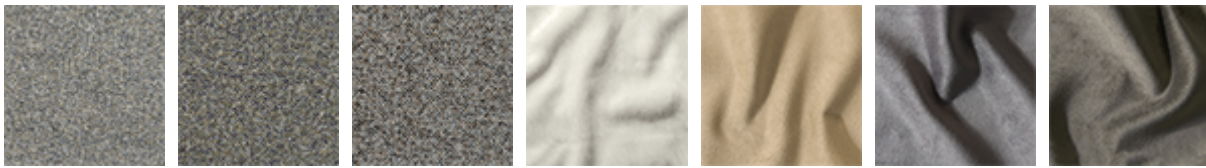
B220 B221 B222 B230 B231 B232 B233