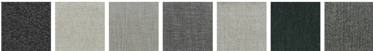
B435 B520 B521 B522 B530 B531 B540