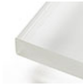
extra hell weiß