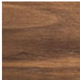
NC nussbaum canaletto