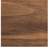
NC nussbaum canaletto