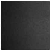
GFM69 graphit gaufriert