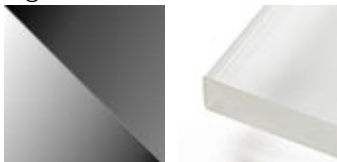
extra hell graphit extra hell weiß