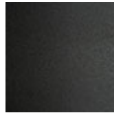
GFM69 graphit gaufriert