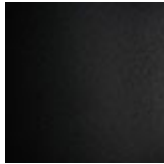
GFM73 schwarz gaufriert