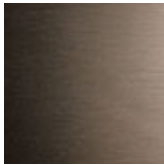
11 satiniert titan